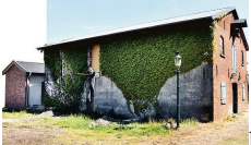
Kulturmühle baut im Verborgenen

Fluchttreppe wird angebracht - Renovierung der Toilettenräume vor dem Abschluss